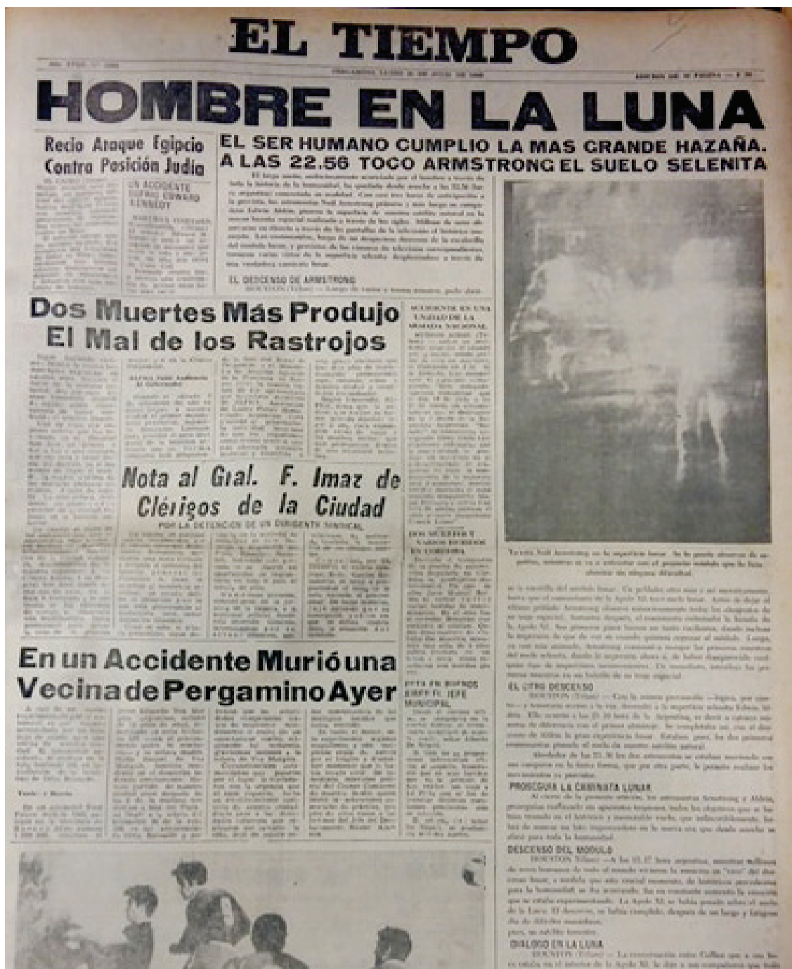
Tapa de EL TIEMPO 1969

1967.- El Tiempo recibe una distinción de su colega El Debate de Zárate que consiste en una medalla de oro y un diploma.